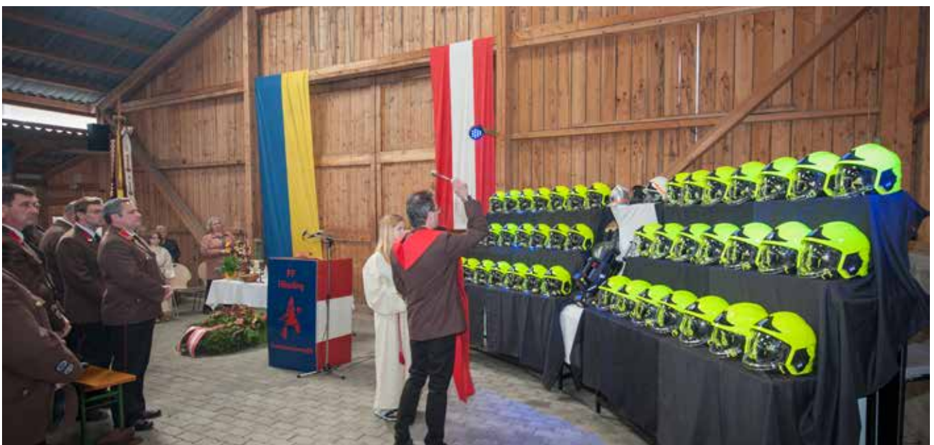
Segnung der neu angekauften Helme und des Akku-Rettungssatzes